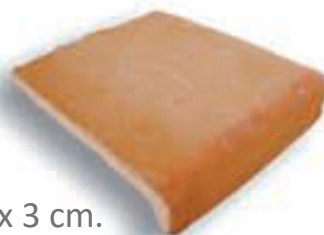
Peldaño 25 x 34 x 3 cm. AL-584