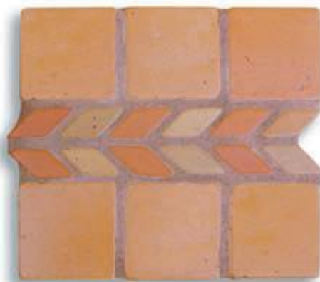
Ref. 12 T (7x29x2/1 cm.) AL-460 Ref. 12 Mx (7x29x2/1 cm.) AL-530 Ref. 12 M (7x29x2/1 cm.) AL-650