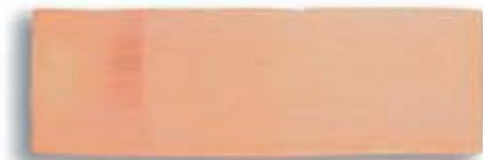
Bóveda recta 20 x 60 x 2,5 cm. AL-211