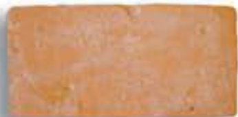
18 x 36 x 2,3 cm. AL-880