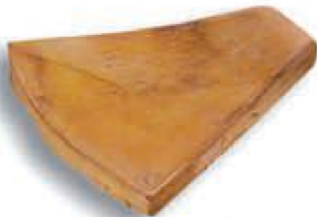
Angulo piscina 30 x 32 cm. AL-490