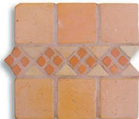
Ref. 7 T (7'5x31x2/1 cm.) AL-460 Ref. 7 Mx (7'5x31x2/1 cm.) AL-530 Ref. 7 M (7'5x31x2/1 cm.) AL-650