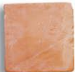
25 x 25 x 2 cm. AL-860