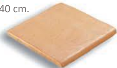
Vierteaguas 30 x 30 cm. AL-260 Vierteaguas 40 x 40 cm. AL-450