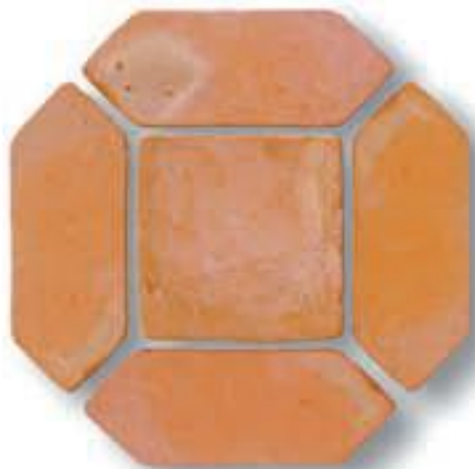
Naveta 11,5 x 31 x 1,5 cm. + 20 x 20 x 2 cm. AL-910