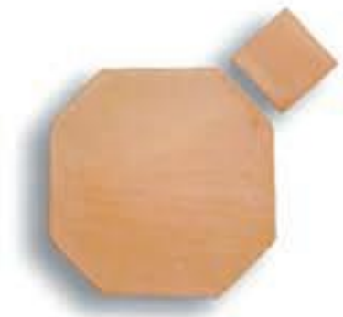
Octógono 28 x 28 x 2 cm. + taco 9 cm. AL-720 Octógono 20 x 20 x 2 cm. + taco 5 cm. AL-830 Suplemento taco mármol AL-370 Suplemento taco esmaltado AL-481