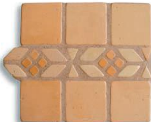
Ref. 9 T (7x34x2/1 cm.) AL-460 Ref. 9 Mx (7x34x2/1 cm.) AL-530 Ref. 9 M (7x34x2/1 cm.) AL-650