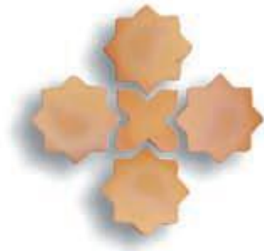
Estrella 10 cm. + Cruz 10 cm. AL-950