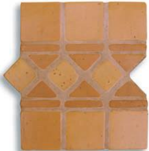
Ref. 1 T (16x30x2/1 cm.) AL-560 Ref. 1 Mx (16x30x2/1 cm.) AL-620 Ref. 1 M (16x30x2/1 cm.) AL-650