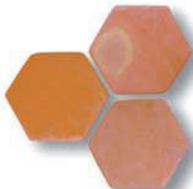
Hexágono 20x20x2 cm. AL-910 Hexágono 10x10x1 cm. AL-977