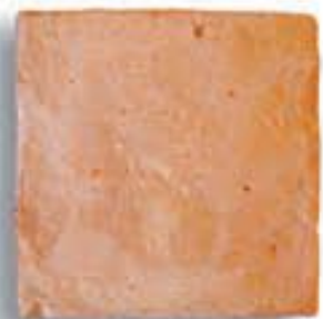
30 x 30 x 2,2 cm. AL-830