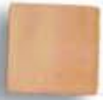
13 x 13 x 1 cm. AL-790