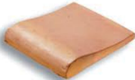
Remate piscina 30 x 32,5 cm. AL-410