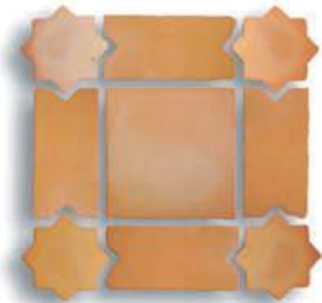
Estrella 10 cm. + Navada + 20 x 20 x 2 cm. AL-840 Suplemento Estrella esmaltada AL-74 Suplemento Estrella pincelada AL-84