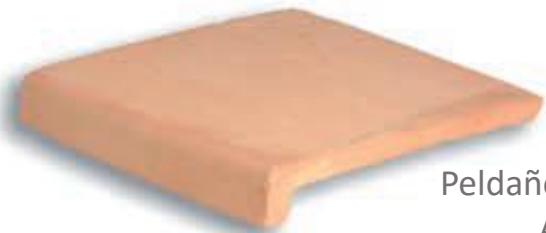
Peldaño 40 x 40 cm. AL-600