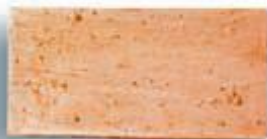
Macizo 12 x 25 x 3 cm. AL-20 Macizo 12 x 25 x 2,5 cm. AL-20 Macizo 15 x 30 x 2,5 cm. AL-58