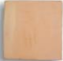
25x 25 x 2 cm AL-670