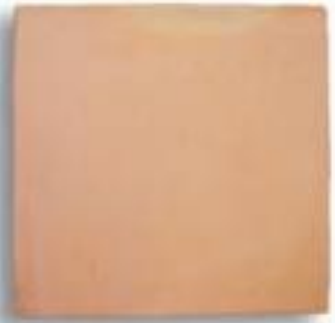
40 x 40 x 2,7 cm AL-770