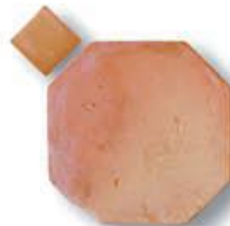
Octógono 28 x 28 x 2 cm. + taco 9 x 9 cm. AL-870