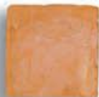
20 x 20 x 2 cm. AL-880