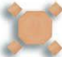
Octógono 13 cm. AL-910 Octógono 10 cm. AL-910