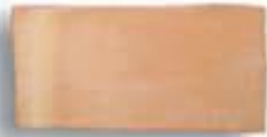
15 x 30 x 2,2 cm. AL-690