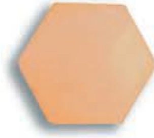
Hexágono 20 x 20 x 2 cm. AL-770 Hexágono 10 x 10 x 1 cm. AL-850