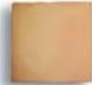
20 x 20 x 2 cm AL-640