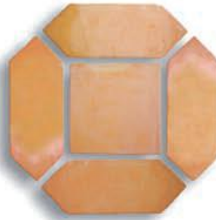
Naveta 11,5 x 31 x 1,5 cm. + 20 x 20 x 2 cm. AL-760 Beig 10 x 10 x 1 cm. AL-852