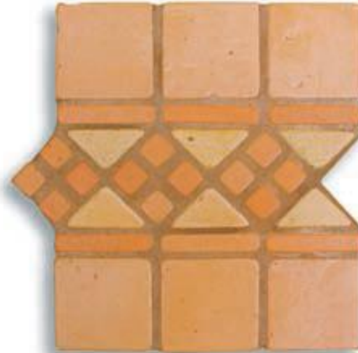
Ref. 15 T (16x30x2/1 cm.) AL-560 Ref. 15 Mx (16x30x2/1 cm.) AL-620 Ref. 15 M (16x30x2/1 cm.) AL-650