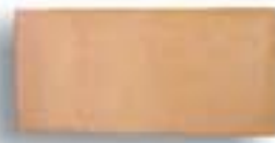
12 x 25 x 2 cm. AL-720