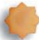
Estrella 10 cm. AL-70 Estr. Esmaltada AL-100 Estr. Pincelada AL-140