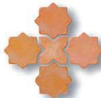
Estrella 10 cm. + Cruz 10 cm. AL-1270