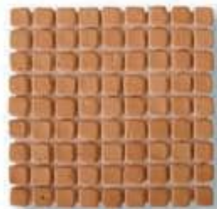
Composición 3 x 3 x 1/2 cm. AL-1210