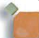
10 x 10 x 1 cm. 1c/c ó 2 c/c AL-980