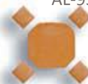
Octógono 10 cm. AL-977