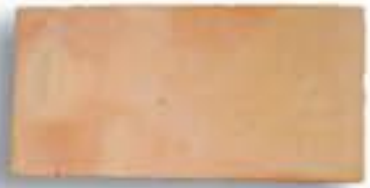
18 x 36 x 2,3 cm. AL-680