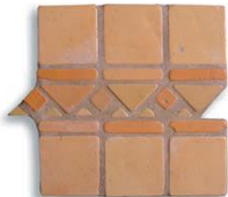
Ref. 20 T (9x30x2/1 cm.) AL-460 Ref. 20 Mx (9x30x2/1 cm.) AL-530 Ref. 20 M (9x30x2/1 cm.) AL-650