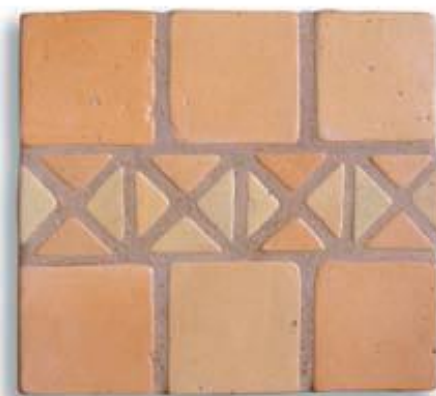
Ref. 13 T (7'5x30,5x2/1 cm.) AL-460 Ref. 13 Mx (7'5x30,5x2/1 cm.) AL-530 Ref. 13 M (7'5x30,5x2/1 cm.) AL-650