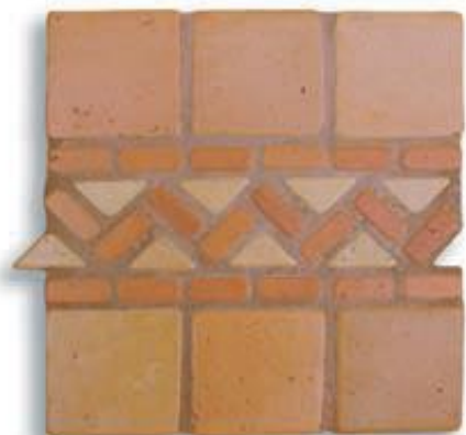
Ref. 21 T (11,5x29,5x2/1 cm.) AL-560 Ref. 21 Mx (11,5x29,5x2/1 cm.) AL-620 Ref. 21 M (11,5x29,5x2/1 cm.) AL-650