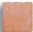
13 x 13 x 1 cm. AL-974