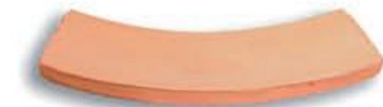
Bóveda curva 17,5 x 48 x 2 cm. AL-211