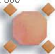
Octógono 13 cm. AL-977