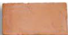
15 x 30 x 2,2 cm. AL-880