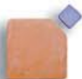
13 x 13 x 1 cm. 1c/c ó 2c/c AL-980