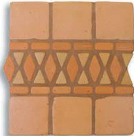
Ref. 11 T (12,5x30x2/1 cm.) AL-560 Ref. 11 Mx (12,5x30x2/1 cm.) AL-620 Ref. 11 M (12,5x30x2/1 cm.) AL-650