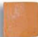
15 x 15 x 1,6 cm. AL-880