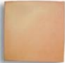
30 x 30 x 2,2 cm AL-670