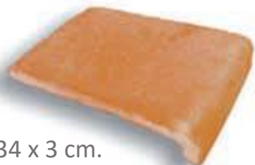
Peldaño 30 x 34 x 3 cm. AL-630