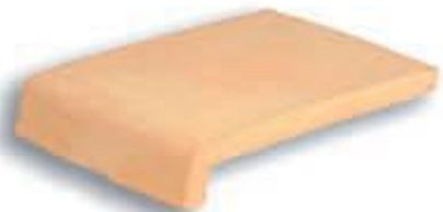
Peldaño 25 x 34 cm. AL-340 Peldaño 30 x 34 cm. AL-440