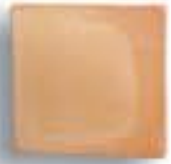
15 x 15 x 1,6 cm. AL-760